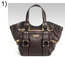
the bag, purse

Words to Match: el descanso - el sillón - la televisión - la estantería - la bolsa - la silla - el escritorio - el teléfono - el despertador - los muebles - el bote de basura - la recámara