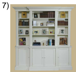
bookcase or shelves